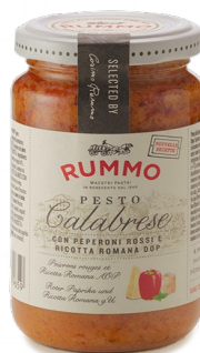
132805 Pesto Alla Calabrese 190 Gr - X6 Rummo