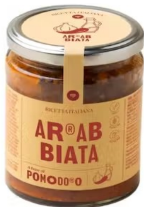
601412 Sugo ARRABBIATA 280 gr - X6 Pomo d'oro