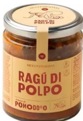
601414 Ragù POPO 280 gr - X6 Pomo d'oro