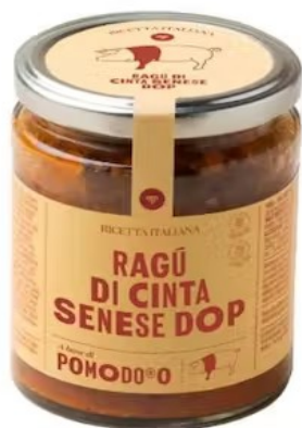
601414 Ragù CINTA SENESE 280 gr - X6 Pomo d'oro