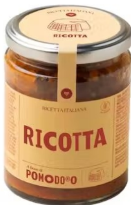
601413 Sugo RICOTTA 280 gr - X6 Pomo d'oro