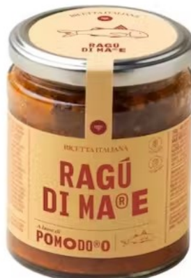
601415 Ragù di MARE 280 gr - X6 Pomo d'oro