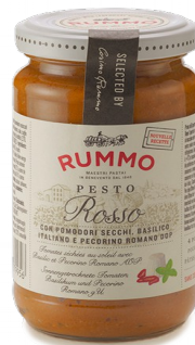
300742 Pesto Rosso 190 Gr - X6 Rummo