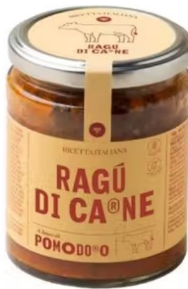
601413 Ragù di CARNE 280 gr - X6 Pomo d'oro