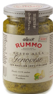
300741 Pesto Alla Genovese 190 Gr - X6 Rummo